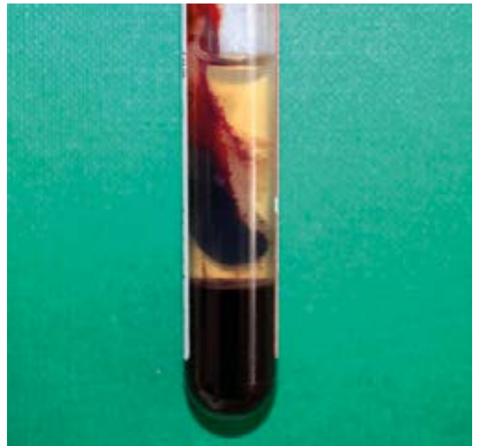
Φυσιολογικό δείγμα αίματος

Τα γαϊδούρια είναι ιδιαίτερα ευάλωτα στην υπερλιπιδαιμία. Έχουν προσαρμοστεί να ζούνε σε δύσκολες περιβαλλοντικές συνθήκες με αραιή, κακής ποιότητας βλάστηση και από την φύση τους θα περπατούσαν για έως και 16 ώρες την ημέρα προς αναζήτηση τροφής. Ως αποτέλεσμα, τα γαϊδούρια που ζούνε σε σχετικά καταπράσινους βοσκότοπους με μειωμένη φυσική άσκηση, τείνουν να αποκτούν περιττό λίπος. Εάν αυτά τα ζώα σταματήσουν να τρώνε για οποιοδήποτε λόγο, η υπερλιπιδαιμία είναι πιθανόν να αναπτυχθεί σε αυτά.